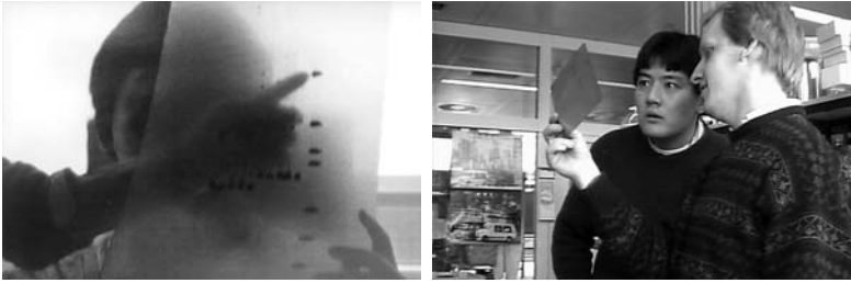
Kamerablicke auf Blickarbeit im Labor

medienspezifisch und anhand von Perspektiven, die mit den eigenen Verfahren korrespondieren. Der schreibende Forscher entdeckt »manic writers«; das konversationsorientierte Team eine geschwätzige Kultur; die Ethnographin mit der Kamera spürt Artisten des Sehens auf. Die Video-Beobachtung bezieht Schreibaktivitäten wie Protokollieren und Beschriften erst in dem Bewusstsein ein, dass diese Tätigkeiten Hilfsmittel bei der Herstellung von Sichtbarkeit im Labor sind. Vordergrundig sieht die Kamera-Ethnographin die Laborteilnehmer nicht schreiben, sondern sehen, und insbesondere sehen, was sie nicht sieht.