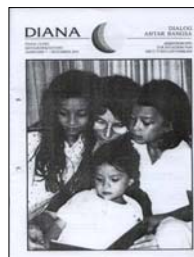
Deutsche Mutter mit ihren deutsch-indonesischen Töchtern