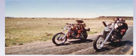
Easy Rider, 1969

George: Sie haben keine Angst vor uns, sie haben Angst vor dem, was Du für sie repräsentierst. Billy: Ach, Mann – alles, was wir für sie repräsentieren, ist nur jemand, der sich nicht die Haare schneidet! George: Oh, nein. Was Du für sie repräsentierst, ist Freiheit. (...) Aber wehe, Du sagst jemand, er sei nicht frei, dann ist er sofort bereit, Dich zu töten oder Dich zum Krüppel zu schlagen, um zu beweisen, dass er frei ist. Auja, sie reden und reden und reden über individuelle Freiheit, aber sehen sie dann ein freies Individuum, kriegen sie es mit der Angst. Sie werden vor Angst nicht gerade weglaufen, aber es macht sie gefährlich.