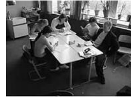
Integrierte Gesamtschule in Niedersachsen

Lehrer/innen sind als „definitionsmächtige Akteure“ in der privilegierten Position ihre Version der Wirklichkeit öffentlich durchzusetzen“ (Goffman 1994: 104). Ihr Vorstellungen, Erfahrungen und Versionen von Wirklichkeit sind Referenzen für ihre Bewertung von Leistung und von erfolgreichen Bildungswegen. Zwar gibt es hinreichend Forschung zur Ausbildungssituation und zum professionellen Handeln von Lehrerinnen und Lehrern, es fehlt aber bislang an einer systematischen Beschreibung und Rekonstruktion der Genese der Lehrer/innen/wirklichkeit.