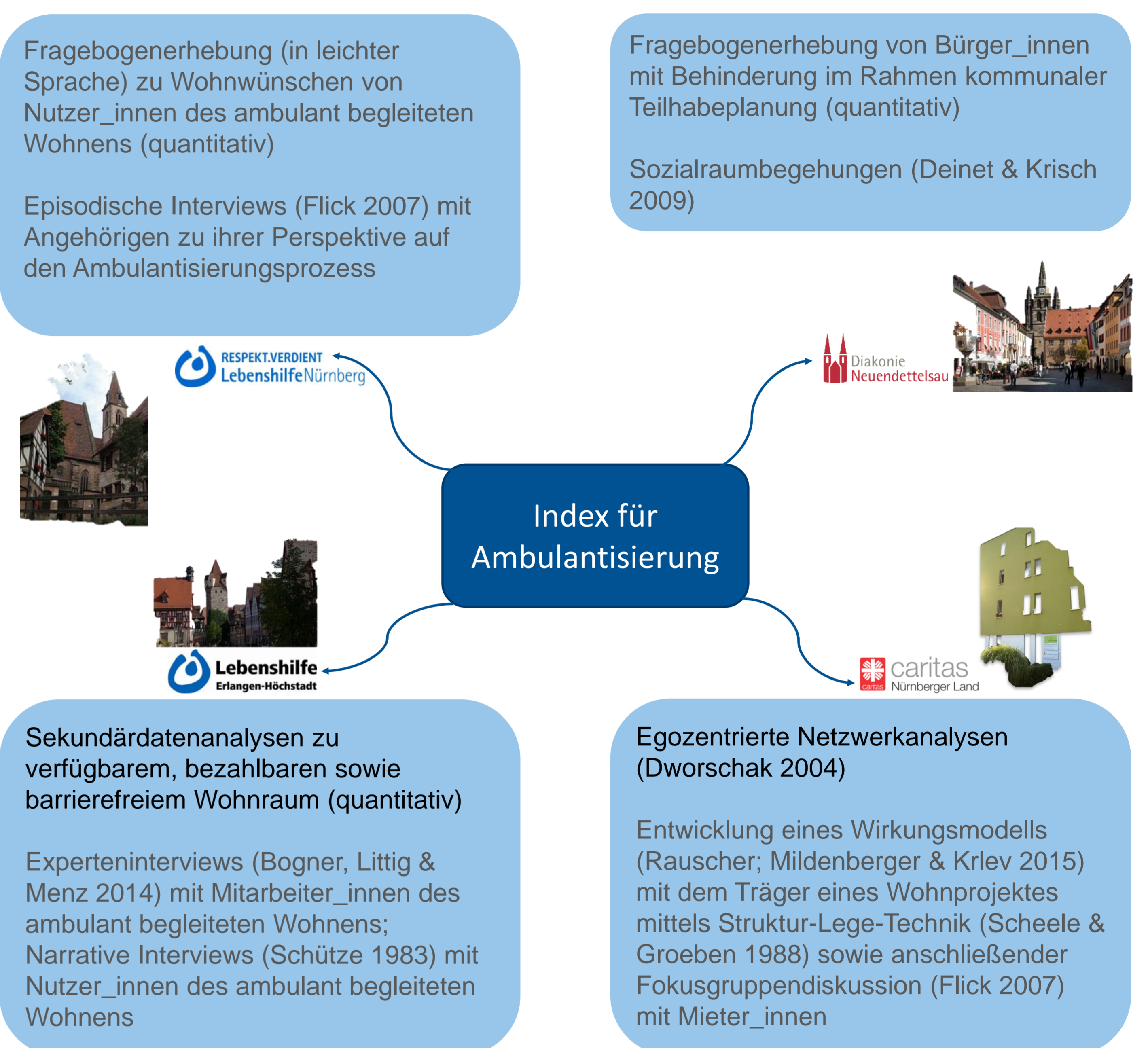
Abb. 4: Datengrundlage für den Index für Ambulantisierung in den einzelnen Modellregionen (schwarz = abgeschlossen; grau = fortlaufend)

Auf dieser Grundlage wurden gemeinsam Fragestellungen und kleine Erhebungsdesigns für die einzelnen Regionen entwickelt, sowie qualitative und quantitative Daten erhoben: