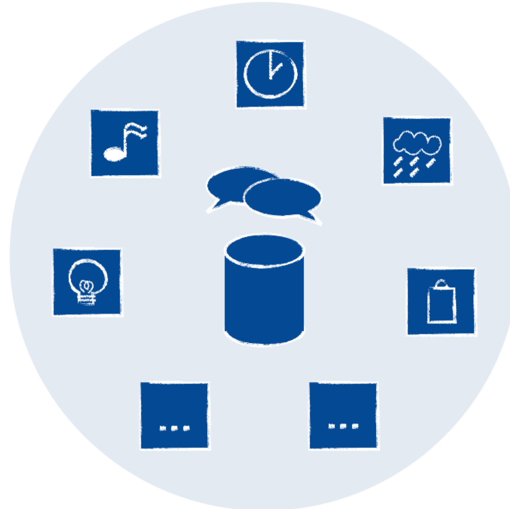
Sprach-gesteuerte Assistenten wie Amazon's Alexa oder GoogleHome ermöglichen u.a., die Steuerung von Unterhaltungsmedien oder Lichtsystemen.